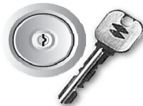
ディスクシリンダー錠